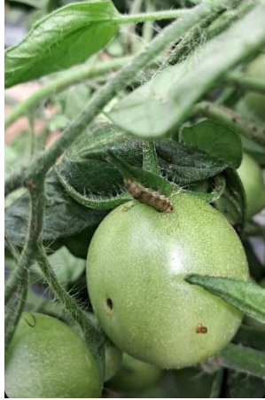
པར་རིས་༡༩ པ། གཞོན་འབྲུག་ Helicoverpa armigera

གཞོན་འབྲུག་གིས་ མགུ་ཉོ་ནང་ན་བཙུགས་ཏེ་ རྟོག་མ་ཚུ་ནང་ རྟོང་སྟེད་དེ་འཛུལ་ཕྱིན། འབྲུག་གིས་ རྟོག་མ་གཅིག་ལས་ གཞན་ལུ་སྟོ་སྟེ་ གཞོན་སྐྱོན་རྒྱབ་སྟེ་ སོན་བཏོན་ནི་ལུ་ འོས་འབབ་མེད་པ་བཟོ་ཕྱིན། རྟོག་མ་གི་ལ་ཐོག་ལུ་ རྟོང་ སྐྱར་སྐྱར་སྟེ་ཡོད་མི་འདི་ འབྲུག་གིས་གཞོན་སྐྱོན་རྒྱབ་བའི་རྟོགས་ཅིག་ཡིན།