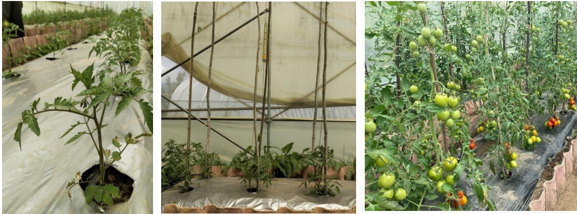
Right stage of staking and Tying Plants trained to wooden poles Fruiting plants supported with wooden poles

འཛིན་ཤིང་བཙུགས་དགོ་པའི་ ལྷ་མཚན་ངོ་མ་ར་ སྐྱམ་བཞུང་དེའི་ཤིང་ཚུ་ བཏོག་ནི་ལུ་རྒྱབ་སྐྱོར་འབད་ནི་དང་ ཤིང་དང་ རྟོག་མ་ཚུ་ ས་ཁར་རེག་མ་བཙུག་པར་ བཞག་ཐབས་ལུ་ཨིན། ཤིང་གུ་འཛིན་སྟེ་སྐྱེ་མི་ སྐྱམ་བཞུང་དེའི་རིགས་ཚུ་ག་ར་ ཐག་པ་ ཡང་ན་ འཛིན་ཤིང་བཙུགས་ཐོག་ལས་ ཤིང་འབྲེལ་ནི་ལས་བཀག་ནི་དང་ རྟོག་མ་ཚུ་ ས་ཁར་ རེག་མ་བཙུག་ པར་བཞག་སྟེ་ རུལ་ནི་མར་ཡབ་འབད་ཚུགས། འཛིན་ཤིང་འདི་ འོག་གི་པར་ནང་བཀོད་དོ་བཟུམ་བཙུགས་དགོ་པ་ཨིན།