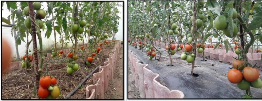
ཕར་རིས་4 པ། མལ་ལུད་དང་འབྲིབ་ཤོག་གིས་ ས་ཐོག་བཀག་ནིའི་ཐབས་རིགས།

རོན་ལྷུ་མ་གྱི་མང་ཉུང་ལུ་བཟུ་སྟེ་ གཡུར་མ་ ཚར་གཉིས་དང་གསུམ་དེ་ཅིག་རྒྱབ་དགོ། རོན་ལྷུ་མ་ཚུ་ ལག་པ་གིས་འབལ་ དགོ། ཡང་ན་ ཤིང་གི་ར་རྩོ་ལུ་མ་གཞོད་པ་སྟེ་ ཀོ་ཏི་གིས་བཞོད་དགོ། རང་བཞིན་འཛོན་སྐྱོད་གི་འོག་ལུ་ རོན་ལྷུ་མ་ཚད་འཛོན་ འབད་ནི་ལུ་དང་ གཞན་མི་ལེ་ཕན་གྱི་དོན་ལུ་ རང་བཞིན་གྱི་རྩ་གདན་ལག་ལེན་འབབ་ནི་འདི་ གནམ་མེད་ས་མེད་ རྒྱབ་ རྩོན་འབད་མ་ཡིན། དེ་མ་ཚད་ འབྲིབ་ཤོག་ལག་ལེན་འབབ་མི་གིས་ཡང་ རོན་ལྷུ་མ་ཚད་འཛོན་འབད་ནི་ལུ་ཕན་མ་ཡིན།