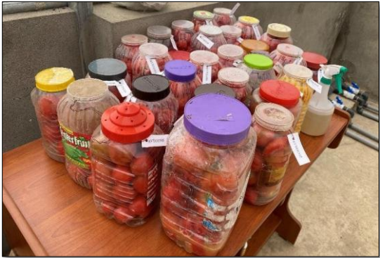
A. Fruits kept for fermentation (1-3 days)

སྐྱུར་རྩམ་ལག་ལེན་འབབ་སྟེ་ སོན་བཏོན་ནིའི་ཐབས་ལམ་ནང་ སྐྱམ་བན་ན་ཚུ་ འབྲིབ་རྩོམ་ནང་བསྐྱད་དགོ།(ཟངས་དང་ ལྷགས་ཀྱི་རྩོམ་ ལག་ལེན་མ་འབབ) དེ་ལས་ བསྐྱད་ཡོད་མི་སྐྱམ་བན་ད་ ཀེ་ཇི་༡༤ ལུ་ སྐྱུར་རྩམ་ Hydrochloric acid མི་ལི་ལི་ཏར་༡༠༠ ལྷག་དགོ། དུས་དང་དུས་སུ་ ཚར་གཅིག་དང་གཉིས་དེ་ཅིག་ དཀྱུག་པ་ཅིན་ སོན་དང་ ལྷགས་ ཀོ་ཚུ་ སོ་སོ་སྟེ་ བཏོན་ཚུགས། རྒྱ་མ་༣༠ གི་རྒྱབ་ལས་ སོན་ཚུ་ ལྷགས་ཀོ་ལས་ སོ་སོ་སྟེ་ བཏོན་ཞིན་མ་ལས་ རྩོམ་ ཀྱི་མཚུག་ལུ་ གཞི་ཆགས་འོང། ཐོག་ཁ་བཤམ་ལུས་མི་ ལྷགས་ཀོ་ཚུ་བཏོན་གཏང་དགོ། སོན་ཚུ་ རྒྱ་གིས་ཚར་གསུམ་དང་ བཞི་དེ་ཅིག་ འལུ་དགོ། རྒྱ་འལུ་ཡོད་མི་སོན་ཚུ་ ཉི་མའི་འོད་ འལུ་མེད་ས་ རྒྱམ་དགོ།