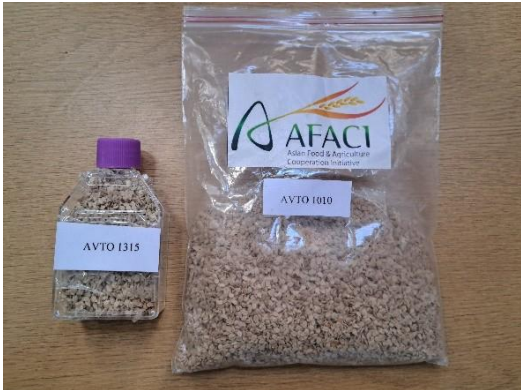
བར་རིས་༡༠ པ། སོན་བསག་བཞག་ནི།