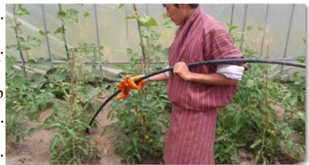
པར་རིས་ 3 བ། ལྷང་མ་གི་རྟོ་རྩ་བ་ ཚུ་སྒྲུག་ནི།

ལྷང་མ་ཚུ་ལེགས་ཤོམ་སྟེ་ སྟེམ་བཅུག་ནིའི་དོན་ལུ་ སྟོ་བཅུགས་འབད་ཚར་བའི་ཤུལ་ལས་ བདུན་ཕྱག་དག་པ་ཅིག་གི་རིང་ལུ་ ས་ཞིང་ གི་ཤོང་ཚད་དང་བསྟུན་ ཚུ་སྒྲུག་དགོ། སྟོ་བཅུགས་འབད་ཞིན་མ་ལས་ བདུན་ཕྱག་ 2-4 གི་ནང་འཁོད་ལུ་ ཚུའི་ཚད་དང་ སྒྲུག་ནིའི་ ཚད་གཞི་ མར་ཕབ་འབད་དགོ། དེ་གིས་ མེ་རྟོག་ཤར་ནི་དང་ ཐོན་སྐྱེད་ཡར་ཤུག་གཏང་ནི་ལུ་ཕན་ཐོགས་ཡིན། རྫོག་མ་བཏགས་ཞིན་མ་ལས་མེ་རྟོག་རུལ་ནི་དང་ རྫོག་མ་ཚུ་གག་འཕྱོ་ནི་ དེ་ལས་ རྫོག་མའི་སྤུས་ཚད་ཡར་ཤུག་གཏང་ནིའི་དོན་ལུ་ སའི་སློན་ གཤེར་གྱི་ཚད་ ཤོ་མཚུངས་སྟེ་བཞག་དགོ། སྤུབ་འབྲས་ལེགས་ཤོམ་གྱི་ དོན་ལུ་ ཚུ་ཉུང་སྟེ་སྒྲུག་ནི་(micro-irrigation or drip irrigation) རྒྱབ་སློན་འབད་ཕ་ཡིན། ཚུ་འདི་ལག་པ་གིས་སྒྲུག་དགོ་པ་ ཅིན་ སྐྱམ་བཞན་དེའི་ཤིང་གི་རྟོ་གི་ས་ཁོངས་ནང་ སྒྲུག་དགོ། འདི་གིས་ སྐྱམ་བཞན་དེའི་ཤིང་ སློན་མ་འཕྱོ་ནི་ལས་བཀག་སྟེ་ བད་གཞི་ཐོན་ནི་ལས་ བཀག་ཐབས་འབད་ཚུགས།