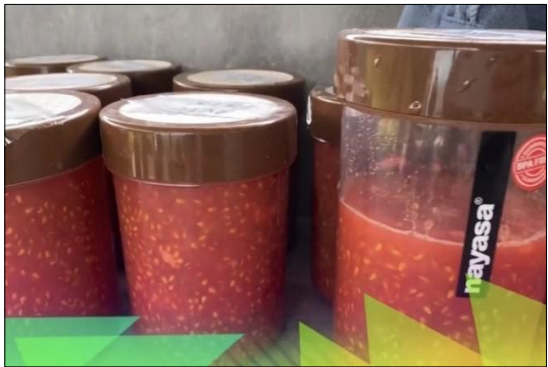
B. Extracted pulp