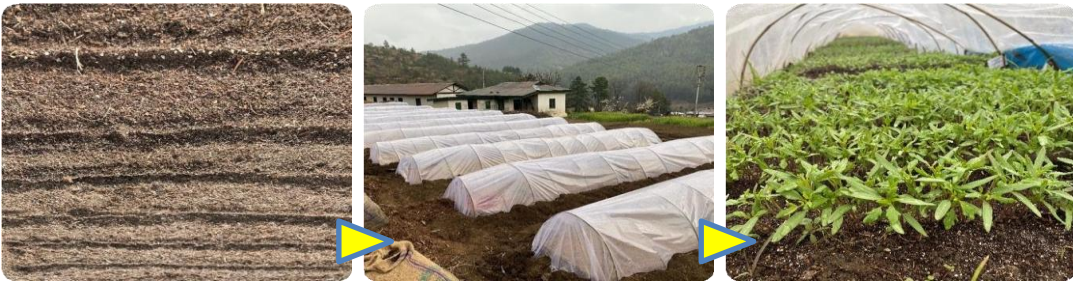
བར་རིས་, པ། ས་སྐྱོར་བཟོ་ཐངས།

སོན་མ་བཟབ་པའི་ཉེ་མ་ ལུང་མ་འཇུགས་སྐྱོང་ཁང་ གྲུ་སྐྱིག་འབད་དགོ། རྫོང་འདམ་གོང་ དེ་ལས་ གཞན་རག་རོ་ཚུ་ བཏོན་བཀོ་ སྟེ་ སའི་ཐོག་ཁང་ མལ་ལུང་ལྷགས་དགོ། ས་ སྐྱོར་ཉེ་ མཐོ་ཚད་སེན་ཁི་མི་ཏར་ १4-20 དང་ རྒྱ་ཚད་མི་ཏར་ १ དེ་ལས་ རིང་ ཚད་སྟབས་བདེ་ཏོག་ཏོ་སྟེ་བཞག་དགོ། ལུང་མ་ཚུ་ མཚོ་གསུམ་སྟེ་སྟེམ་ནི་ལུ་ ཉེན་སྲུང་འབད་དེ་ཡོད་པའི་འཇུགས་སྐྱོང་ཁང་ ཡང་ན་ གོང་ཚད་རན་པའི་ འབྲིབ་ལྷིམ་ཚུ་ནང་ འཇུགས་སྐྱོང་འབད་དགོ། དེ་གིས་ ལོ་ཐོག་འདི་ ཆར་པ་དང་ བ་མོ་ དེ་ལས་ ཉེ་མ་ལས་ ཉེན་སྲུང་འབད་ཚུགས་པ་ཨིན། རང་བཞིན་གྱི་ལུང་ ལེགས་ཤོམ་སྟེ་མ་རུལ་མི་ ཡང་ན་ འོམ་གྱི་ཕྱགས་སྟེགས་ལས་ བཟོ་ མི་ ལུང་ཚུ་ལུ་ གཞོན་འབྲུམ་དང་ནད་གཞི་ཚུ་ འོང་སྲིད་ནི་ཨིན་མ་ལས་ འཇུགས་སྐྱོང་འབད་མི་ས་གཞི་ནང་ ལག་ལེན་འཐབ་ནི་མི་ འོང་། སའི་ཐོག་ཁང་ བཅག་ཡོད་མི་མལ་ལུང་ཚུ་ ལག་ལེན་འཐབ་དགོ་པ་སྟེ་ རྒྱབ་སྟོན་འབད་མ་ཨིན།