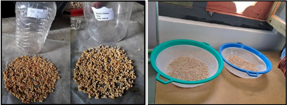
བར་རིས་༧ བ། སོན་སྐྱམ་ནི།

སོན་ཚུ་རུལ་འབྱོ་ནི་ ཡང་ན་ བད་གཞི་ཐོབ་ནིའི་ཉེན་ཁ་ལས་བཀག་ནི་ལུ་ ག་དེ་མཚུགས་མཚུགས་ སྐྱམ་དགོཔ་ཨིན། སོན་སྐྱམ་ནི་ལུ་ ས་ཁོངས་ལེགས་ཤོམ་འདི་ ཚ་བྲོད་རན་ཏྲོག་ཏྲོད་དང་ སྐྱམ་ས་ དེ་ལས་ ལྷུང་མ་ལེགས་ཤོམ་སྡེ་འོང་སའི་ ས་ཁོངས་ཚུ་ཨིན། སྡེ་ཚལ་ཤེལ་བྱིམ་དང་ ལ་ཐོག་ལེབ་ཏྲེག་ཏྲེ དེ་ལས་ འབྲི་ཁྲི་ཚུ་ག་ར་ སོན་སྐྱམ་བཏང་སའི་ ས་ཁོངས་ ལེགས་ཤོམ་ཅིག་ཨིན། ལྷུང་འཁོར་ཡང་སོན་སྐྱམ་ནི་ལུ་ བཅ་ཐོགས་ཡོད་པ་ཨིན།