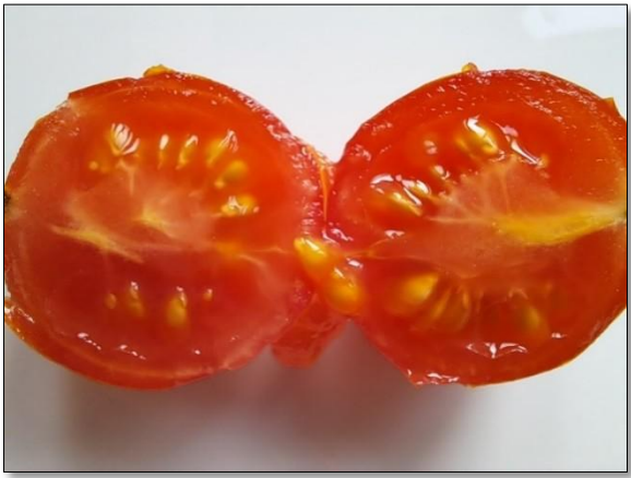
བར་རིས་ 28 པ། སོན་ཡོད་མི་ལྷམ་བན་ད་ རྐྱེད་ཀ་སྐྱེ་བརྟོགས་ཡོད་པ།

ལྷམ་བན་ད་ རྐྱེད་ཀ་སྐྱེ་བརྟོག་སྐྱེ་ སོན་ཡོད་མི་ནང་རྐྱས་འདི་ བཅོར་དགོ། བཅོར་ཡོད་མི་ནང་རྐྱས་དང་སོན་ཚུ་ ཉལ་བཅུག་ནིའི་དོན་ ལུ་ ཉོད་རྒྱུ་ཀྱི་ཅིག་ནང་སྐྱུག་དགོ། ལྷམ་བན་ད་རྒྱུ་ཀྱི་ གཅིག་དང་གཉིས་རྒྱུ་མ་གཅིག་ སོན་བརྟོན་ནི་ཨིན་པ་ཅིན་ རྒྱུ་མ་གཅིག་ རྐྱེད་འདི་ རྐྱེད་སྐྱེད་སྐྱེ་ ཁ་བསྐྱམས་ཞིན་མ་ལས་ ཉིན་མ་, ལས་ 2 གི་རིང་ལུ་ ཚོད་རན་ཏོག་ཏོ་ཡོད་མི་ས་ཁོངས་(རྫོད་ ཚོད་ རི་གི་རི་ སེལ་གི་ཡུལ་ 24 ལས་ 30 དེ་ཅིག་) བན་བཞག་སྐྱེ་ ཉིན་བསྐྱར་བཞིན་དུ་ དཀྱུག་དགོ། ཉིན་མ་དག་པ་ཅིག་གི་རྒྱལ་ ལས་ འདིའི་ཐོག་ཁར་ ཉམ་པ་ཐོན་ནི་འགོ་བཅུགས་འོང།