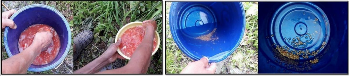
A. Seed extraction by removing the pulp and cleaning seeds