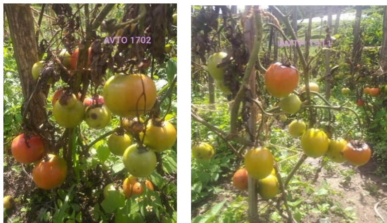
པར་རིས་༡༩ པ། བན་གཞི་ Phytophthora infestans

རང་བཞིན་མིན་པའི་འཇུགས་སྐྱོང་པ་གི་དོན་ལུ། ལྷར་སྐྱོལ་གི་ལམ་ལུགས་ཚུ་ འབྲུས་ཤོར་བ་ཅིན་ ཚུ་ ལི་ཁར་རེ་ལུ་ ཉམས་སྲུན་(Mancozeb) གཞུམ་ ༩ སྤྱི་བཟེ་སྟེ་ བདུན་ཐག་གཉིས་ཀྱི་རྒྱབ་ལས་ ཚར་རེ་ ལྷག་དགོཔ་ཨིན།